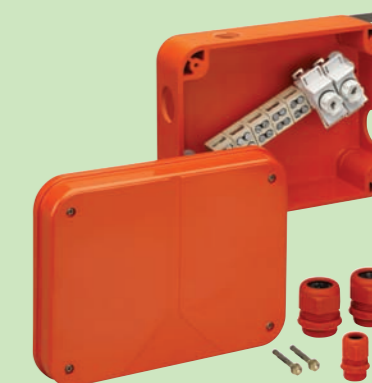
WKE 54 - IP 67 278 x 208 x 108 mm

Caja de conexión compatible con la norma DIN EN 60670-1, U i = 690 V, Con niveles de función de E30, E60, E90 según norma DIN 4102 Part 12, para uso como caja de derivación con fusibles.